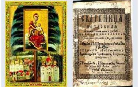
Галятівський Іоанікій. Скарбница потребная и пожиточная всему свету. – Новгород-Северский, 1676. – [8]. 28 л.

В книзі, присвяченій 900-літтю чернігівської єпархії, виданій на початку XX ст., було наведено цікавий місцевий переказ. В ньому йшлося про таке: коли до передмістя Чернігова – Бобровиці прийшло монгольське військо очолюване «поганим царем», воно спалило село й церкву, але Господь покарав за це невірних, все їхнє військо разом із царем раптово осліпло. Хтось з місцевих жителів вказав монголам криницю, вода якої мала здатність повертати зір і цілювати хвороби очей, тоді поганий цар здався чернігівцям і стоячи на горі преклонився перед чернігівським князем, від того часу гора на Бобровиці називається Преклонною, а рів біля неї Поганим. Ця гора і нині височіє над Новгород-Сіверською трасою при виїзді з Чернігова, але в XX столітті вона стала називатися Яцевою горою, по імені першопоселенця новозаснованого села.